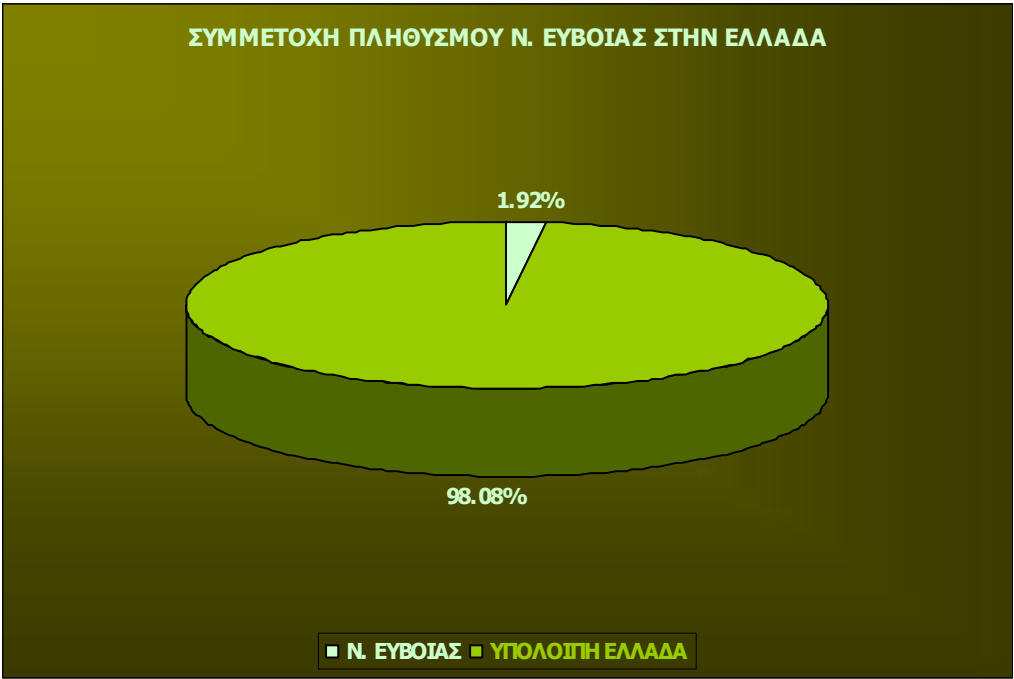
ΔΙΑΓΡΑΜΜΑ 37: ΣΥΜΜΕΤΟΧΗ ΠΛΗΘΥΣΜΟΥ ΝΟΜΟΥ ΕΥΒΟΙΑΣ ΣΤΗΝ ΕΛΛΑΔΑ