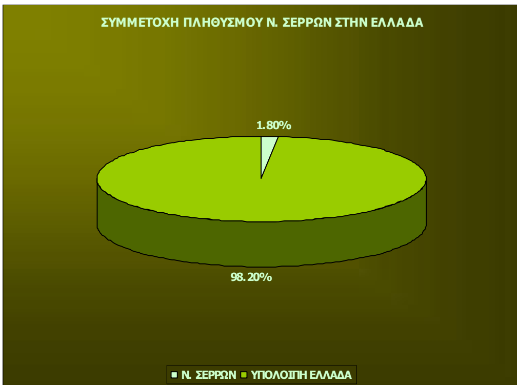
ΔΙΑΓΡΑΜΜΑ 133: ΣΥΜΜΕΤΟΧΗ ΠΛΗΘΥΣΜΟΥ ΝΟΜΟΥ ΣΕΡΡΩΝ ΣΤΗΝ ΕΛΛΑΔΑ