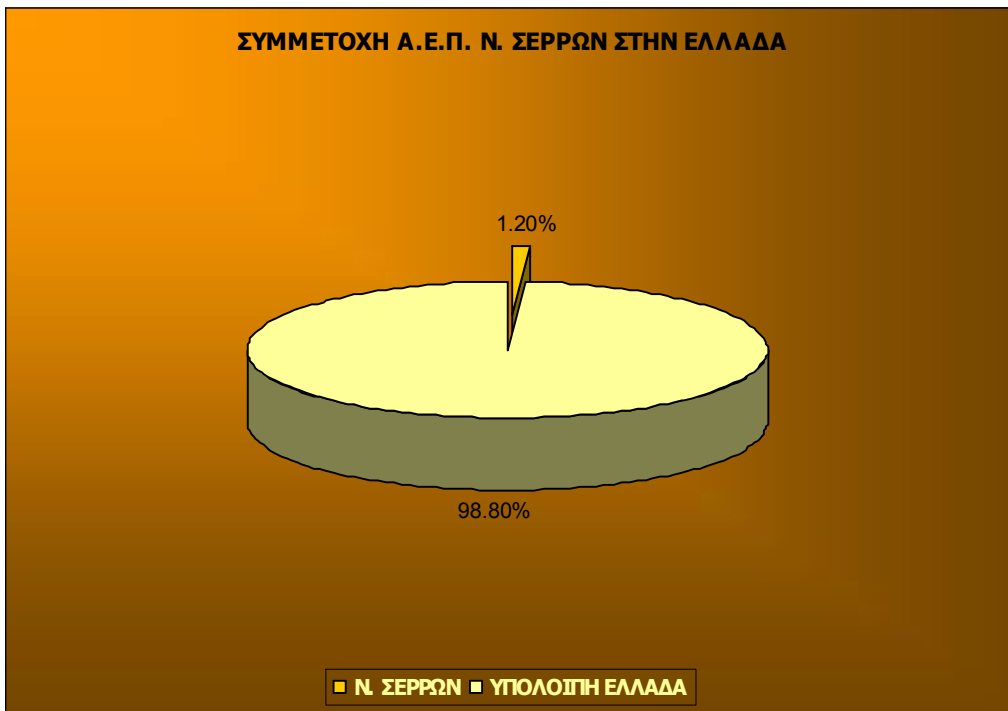
ΔΙΑΓΡΑΜΜΑ 132: ΣΥΜΜΕΤΟΧΗ Α.Ε.Π. ΝΟΜΟΥ ΣΕΡΡΩΝ ΣΤΗΝ ΕΛΛΑΔΑ